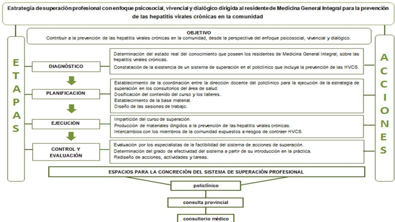
Fig. 1. Estructura de la estrategia de superación profesional dirigida a los residentes de Medicina General Integral para la prevención de las HVCS, desde la comunidad.